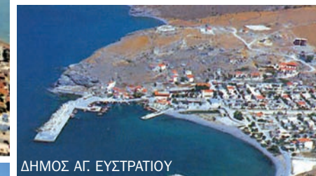
ΔΗΜΟΣ ΑΓ. ΕΥΣΤΡΑΤΙΟΥ

Τα μικρά νησιά του Βορείου Αιγαίου σχεδιάζουν & υλοποιούν τα δικά τους έργα